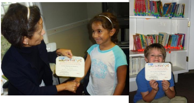
Nos autres fiers gagnants du concours

Les rencontres parents-professeurs auront lieu en novembre. Elles permettent d'évaluer les progrès des enfants, de voir et de parler des évaluations faites en classe. Un grand merci aux enseignantes pour le temps consacré à ces réunions et entretiens, ainsi qu'aux parents pour leur participation et leur intérêt. Grâce à vous tous, et à nos élèves, nous atteindrons nos objectifs pédagogiques dans une ambiance studieuse et chaleureuse !