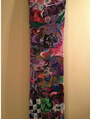
Graffiti-art sur planche à neige !