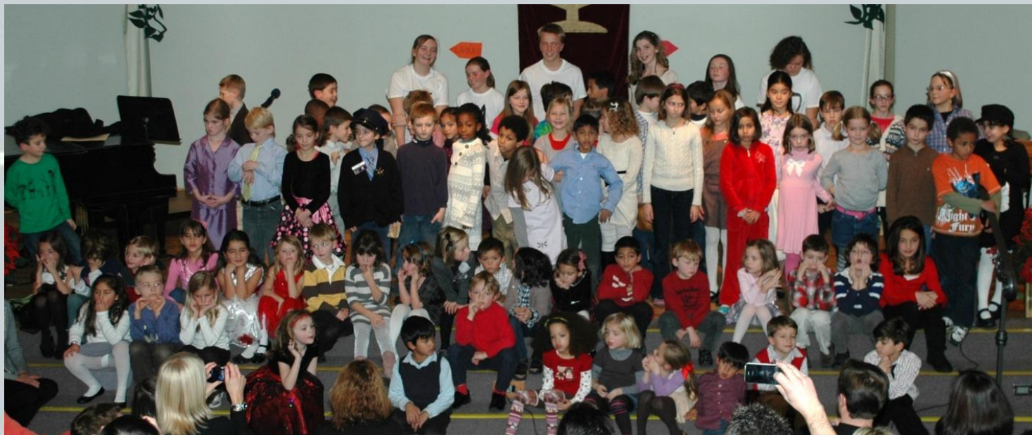
La troupe de PVF au complet!